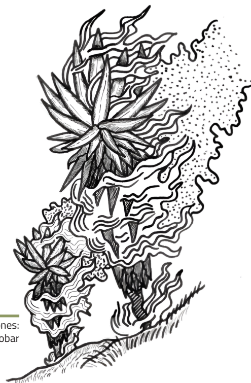
Diseño e ilustraciones: Cristhian Escobar

Lo cierto es que el planeta está en problemas, y nosotros hacemos parte de eso. Para que nos hagamos una idea, según el Banco Mundial, cada año se generan más de 2.000 millones de toneladas de basura en el mundo. Solo en Colombia, son más de 24 millones de toneladas anuales, y lo más alarmante es que casi la mitad viene de nuestras casas. No de las fábricas ni de las grandes industrias, sino de nosotros, de nuestras pequeñas acciones cotidianas.